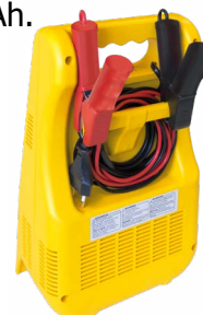
Подреждане на кабелите и скобите в устройството.