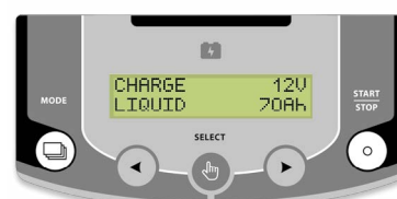
Интуитивен интерфейс на 22 езика