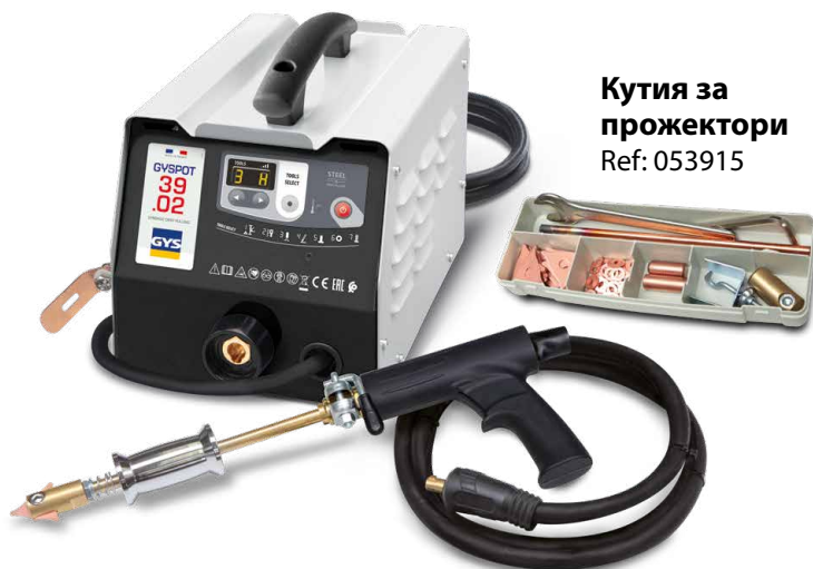
Кутия за прожектори Ref: 053915

Заваряването се задейства автоматично чрез обикновен контакт между инструмента и изправяната част.