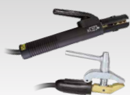
MMA-sæt 500 A - 4 m - 50 mm 2 047419