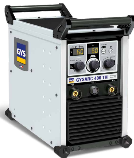
Leveres uden tilbehør