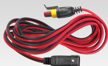
Verlängerungskabel 2.5 m - 029057