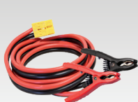
8 m - 16 mm 2 056572