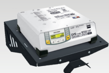
Soporte de pared 055513