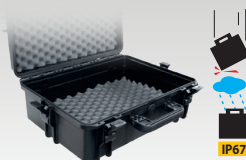
Maletín de transporte 060432