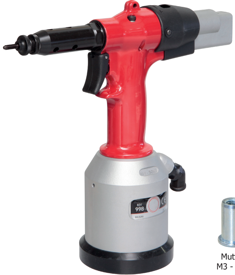
Mutteri M3 - M12