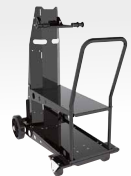
Chariot ref. 041257