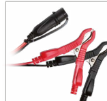
Stezaljke (45 cm)