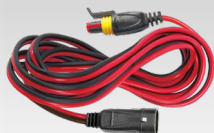
Proširenje 2,5 m - 029057