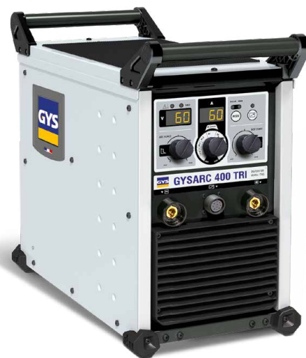
Tartozékok nélkül szállítva