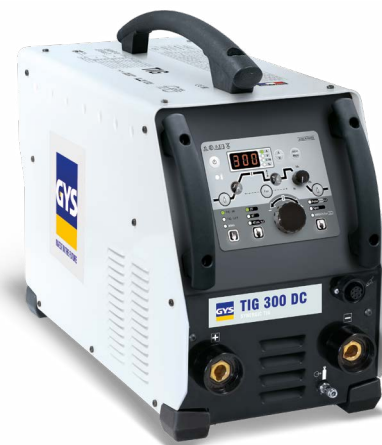
Piegādāts bez piederumiem