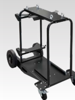
Ratiņi 10m³ 039711