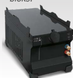
WCU 1kW B 032217