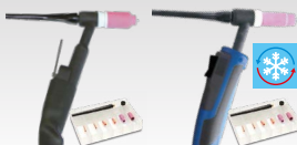
SR26 L 046184