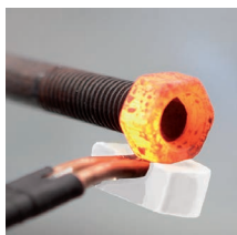
Deblokkeren van moeren