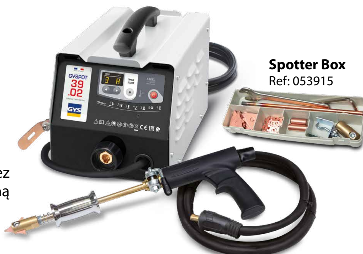
Spotter Box Ref: 053915

Zgrzewanie jest wyzwalane automatycznie przez prosty kontakt między narzędziem a prostowaną częścią.