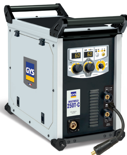
Livrare fără accesorii (014572)