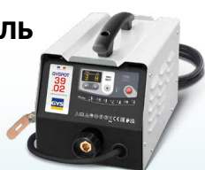
PROLINER 39.02 - Арт. 035775 PROLINER 39.04 - Арт. 035782