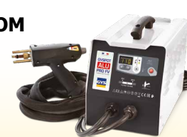
PROLINER ALU PRO FV - Арт. 035836