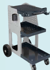
Тележка Spot 800 Арт. 051331