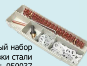
Дополнительный набор для правки стали Арт. 050037