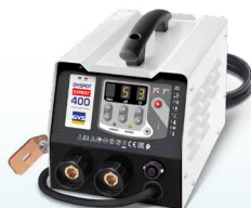
PROLINER PRO 230 - Арт. 035799 PROLINER PRO 400 - Арт. 035805