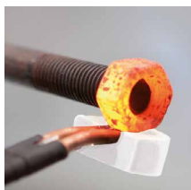
Nới lỏng chỗ bị rỉ sét bu lông