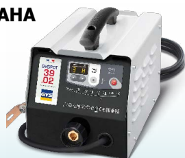
EASYLINER 39.02 - реф. 053618