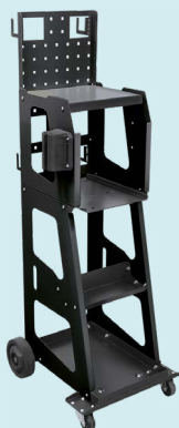
Колечка Spot 1000 реф. 053540