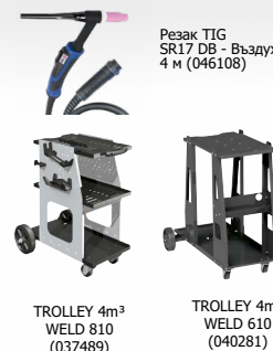
TROLLEY 4m 3 WELD 810 (037489)