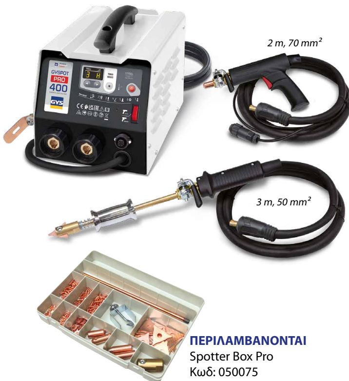
ΠΕΡΙΛΑΜΒΑΝΟΝΤΑΙ Spotter Box Pro Κωδ: 050075