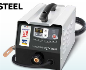
EASYLINER 39.02 - ref. 053618