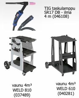
vaunu 4m 3 WELD 810 (037489)