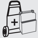
Vaunu 31 x 55 x 93 cm 45,5 kg