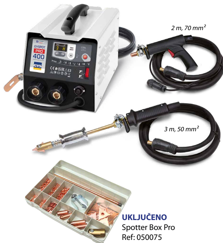
UKLJUČENO Spotter Box Pro Ref: 050075