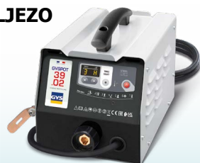
EASYLINER 39.02 - ref. 053618