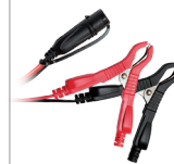
Morsetti (45 cm)