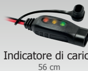
Indicatore di carica 56 cm