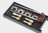
Dėžutė su eksploatacinėmis medžiagomis, skirtomis LANKINIAM TRAUKIMUI 700 068322