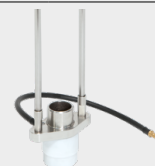
Šakutė su apsauginėmis dujomis 068346