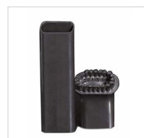
Putekļu sūcējs piederumi