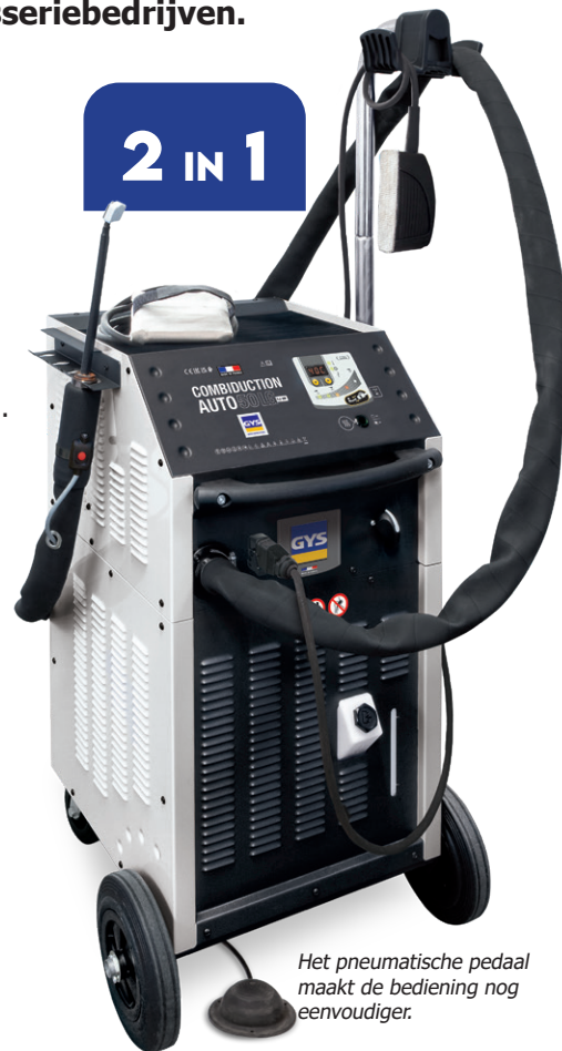
Het pneumatische pedaal maakt de bediening nog eenvoudiger.