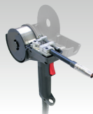
Spool Gun toortsen