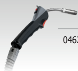
Push Pull toortsen