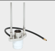
Furcă cu protecție gazoasă 068346