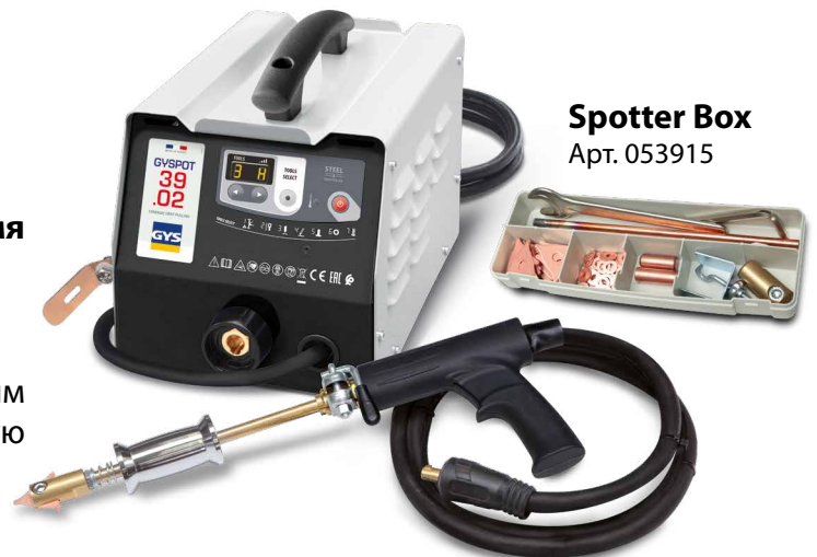
Spotter Box Арт. 053915

Сварная точка совершается автоматически простым контактом между инструментом и деталью, которую нужно выправить.