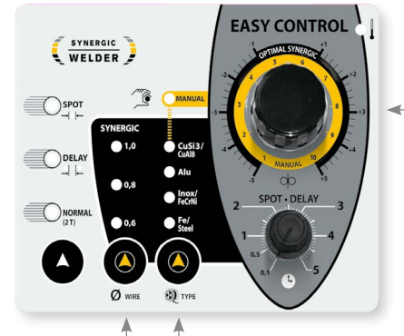
Synergický režim s priamym nastavením parametrov zvárania