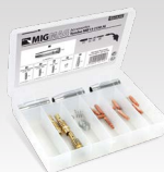
Skrinka na horák MB25 (250 A) 041233