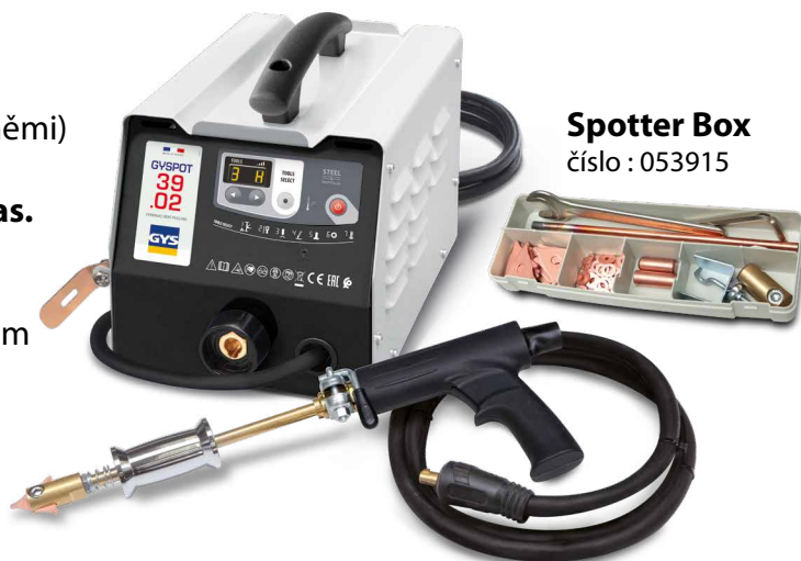
Spotter Box číslo : 053915

svařování je spuštěno automaticky prostým kontaktem mezi nástrojem a rovnáním plechem