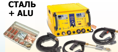
SPEEDLINER Combi 230 E PRO - арт. 036062