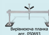
Вирівнююча планка арт. 050693