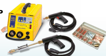
SPEEDLINER PRO 230 - арт. 036017 SPEEDLINER PRO 400 - арт. 036024