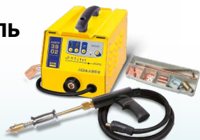
SPEEDLINER 39.02 - арт. 035010 SPEEDLINER 39.04 - арт. 035027