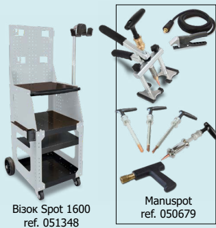
Візок Spot 1600 ref. 051348