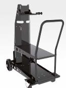
Візок арт. 041257